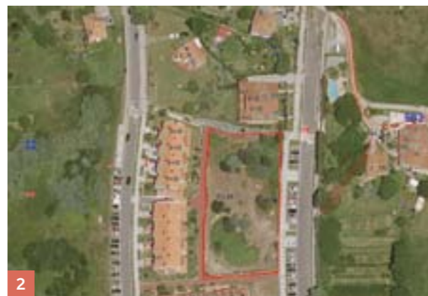
2 4 etxebizitza egiteko partzela Parcela para la construcción de 4 viviendas

Exekutatu gabeko partzela Parcela sin urbanizar