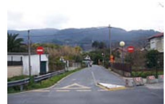
Ibarratorre gaur egun Ibarratorre en la actualidad

El proyecto de las obras está terminado. Como el proyecto pre-vé ampliar el vial, el Ayuntamiento está ultimando los acuerdos para conseguir el suelo necesario para ello. Con una de las per-sonas propietarias ya se ha llegado a un acuerdo y con la otra parte se iniciará un expediente de expropiación. Mientras tan-to el proyecto que define las obras que se harán se ha enviado a URA para que dé su visto bueno y poder empezar.